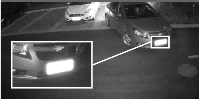
Cámara convencional - Pérdida de detalle