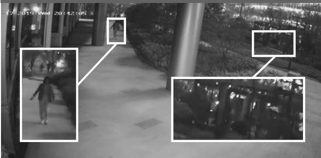
Cámara convencional - Borroso