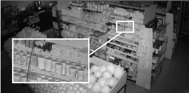
Cámara convencional - No permite identificar el color